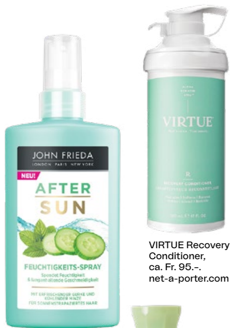
VIRTUE Recovery Conditioner, ca. Fr. 95.-, net-a-porter.com