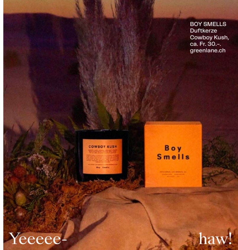
BOY SMELLS Duftkerze Cowboy Kush, ca. Fr. 30.-, greenlane.ch

Schön erholt Sommer – grossartig! Unsere Haare sehen das etwas anders... Chlor und Sonnenstrahlen trocknen sie aus. Wie sie trotzdem genauso relaxt aus den Ferien zurückkehren wie wir? Mit pflegenden After-Sun-Sprays und -Spülungen, die ihnen mit Öl aus dem afrikanischen Baobab-Baum und frischer Minze ihre Kraft zurückgeben.