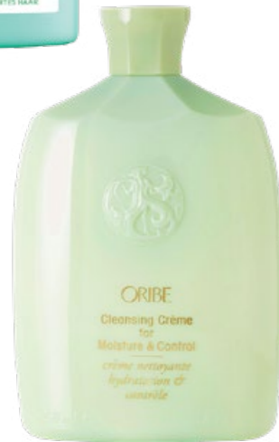
ORIBE Cleansing Crème, feuchtigkeitsspendend, Fr. 52.-, perfecthair.ch

Schön erholt Sommer – grossartig! Unsere Haare sehen das etwas anders... Chlor und Sonnenstrahlen trocknen sie aus. Wie sie trotzdem genauso relaxt aus den Ferien zurückkehren wie wir? Mit pflegenden After-Sun-Sprays und -Spülungen, die ihnen mit Öl aus dem afrikanischen Baobab-Baum und frischer Minze ihre Kraft zurückgeben.