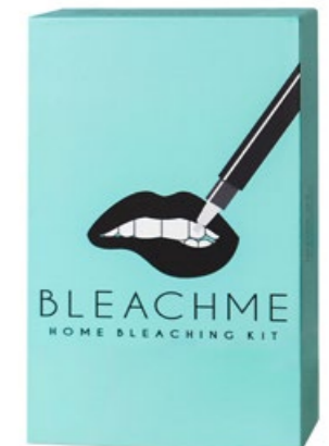
BLEACH ME Set zum Zähne- bleichen zu Hause, Fr. 149.90.

Dass ich plötzlich gelbe Zähne kriege, ist meine Horrorvorstellung. Deshalb bin ich immer auf der Suche nach einem Helfer, der meine Beisser weiss bleiben lässt. Das Set des Schweizer Start-ups Bleach Me besteht aus dem Bleaching-Gel und einer LED-Schiene, die ins Handy oder den Laptop eingesteckt wird. Gewöhnungsbedürftig, aber eigentlich sehr praktisch: Netflix & Bleach. Nach drei Anwendungen sind meine Zähne einen Hauch weisser und nicht so empfindlich, wie das bei anderen Produkten der Fall war.