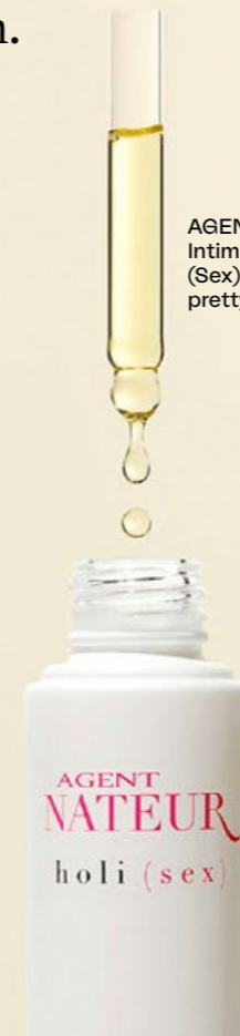
AGENT NATEUR Intimpflegeöl Holi (Sex), Fr. 40.20, prettyandpure.ch

Untenrum frei Lassen Sie uns über Gleitmittel sprechen. Nicht gerade sexy, dieser Satz, oder? Genauso wenig wie die Cremes und Öle, die man bisher damit assoziiert. Hier der Beweis – es ginge so viel besser! Ästhetischer, natürlicher, weiblicher. Das Intimpflegeöl von Agent Nateur spendet mit süssem Mandelöl Feuchtigkeit und riecht mit Rose- und Jasminnoten aphrodisierend. Und sieht so schön aus, dass wir es auf dem Nachttisch präsentieren, statt es in der Schublade zu verstecken.